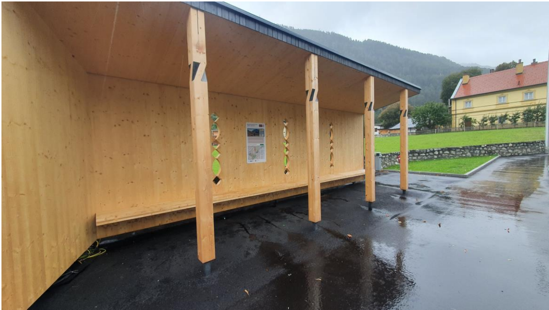
Haltestelle bei der Gemeinde Ried